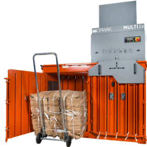
Optional mit Mehrfachabbindung – passend zu Anforderungen von Material und Handling.

Während in der einen Kammer noch verdichtet wird, kann die andere Kammer schon wieder mit neuem Material gefüllt werden. Das Ergebnis ist eine